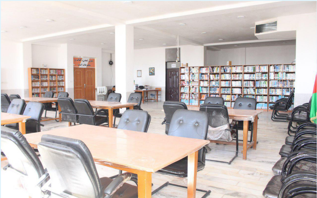
کتابخانه پوهنچی شرعیات