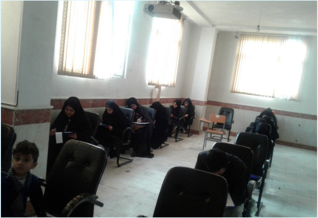
صنوف درسی پوهنځی