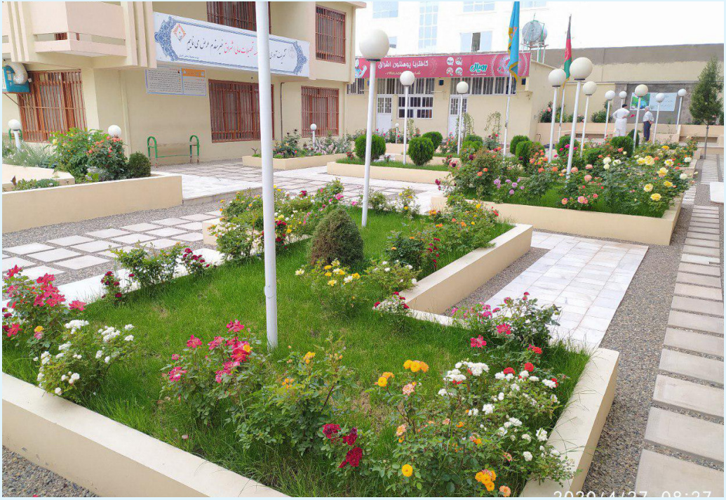
فضای سبز و محل استراحت محصلین پوهنچی